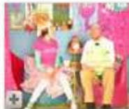
Gorgeous Tiny Chicken Machine Show (Episode 1) 04:11

From: LorcanFinnegan Views: 36,452 ★★★★★ More in Entertainment