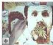
Speed Painting with Ketchup and French Fries 03:57

From: lendavis Views: 536 ★★★★★ More in Pets & Animals