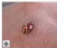
Ladybug Sex On My Hand 00:34

Featured Videos selected by: YouTube Editors