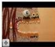
SWEET TALK 00:26

From: EclecticAsylumArt Views: 496,322 ★★★★★ More in Film & Animation